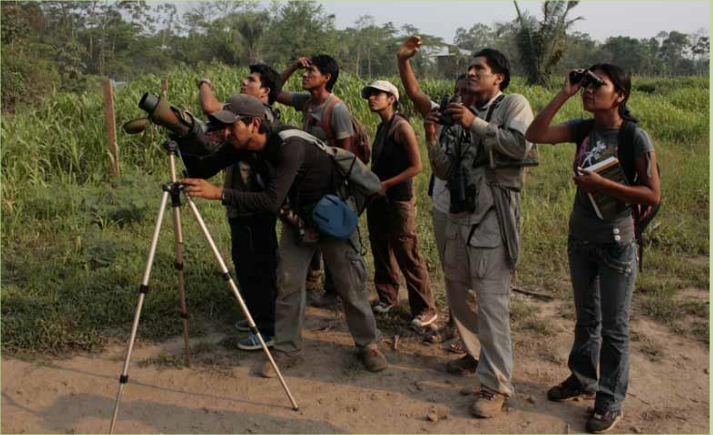
Estudiantes de la Universidad Amazónica de Madre de Dios UNAMAD.